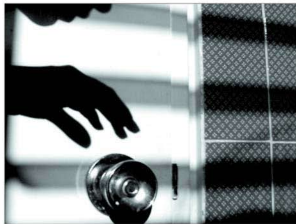
Fotografía incluida en Selfshadows.